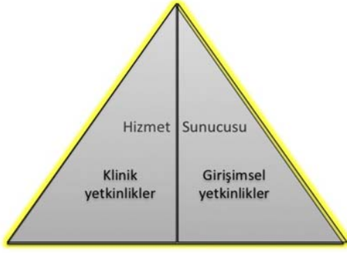
Şekil 2- TUKMOS yedinci temel yetkinlik alanı: Hizmet Sunucusu

Girişimsel Yetkinlik: Bilgiyi, kişisel, sosyal ve/veya metodolojik becerileri tıbbi girişimler konusunda kullanabilme yeteneğidir.