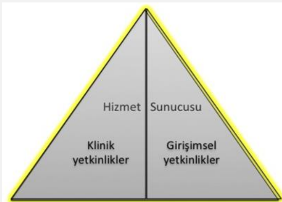
Şekil 2- TUKMOS yedinci temel yetkinlik alanı: Hizmet Sunucusu

Girişimsel Yetkinlik: Bilgiyi, kişisel, sosyal ve/veya metodolojik becerileri tıbbi girişimler konusunda kullanabilme yeteneğidir.